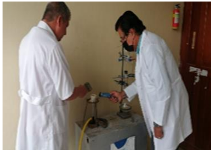
Análisis físicos-químicos y microbiológicos en Lab. microbiológicos.

Durante el año 2022 el Laboratorio de Control de Calidad del Agua de EMAPAS EP, realizó análisis físicos, químicos y microbiológicos en todas las etapas del sistema de abastecimiento, que comprende básicamente: Fuente de Captación, Planta de Potabilización y Redes de Distribución; así como también a los afluentes de descarga del Sistema de Tratamiento Biológico de Aguas Residuales del alcantarillado pluvial, cumpliendo en 99% de los muestreos con las normativas vigentes. Tal como se demuestra en el siguiente análisis correspondiente al mes de diciembre del 2022.